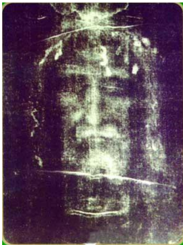
Рис.2. Негатив лица, изображенного на плащанице